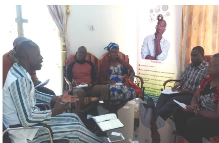
Les acteurs de la SIL MEF échantent avec le responsable du Centre National de la Protection Intellectuelle

Durant le marché des Innovations Agricoles, les micro-entrepreneuses ont enregistré le plus d'engagements d'accompagnement de la part des structures qui étaient présentes. Il