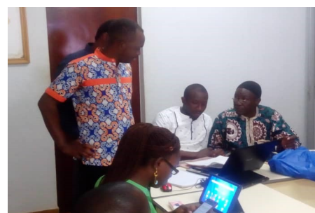
Quelques membres de la Fédération Nationale des Groupements Naam testant l'outil Conseil d'Exploitation

La Fédération Nationale des Groupements Naam (FNGN) a ainsi marqué toute sa satisfaction pour la qualité du travail réalisé. Elle a promis de faire de son possible pour que cela soit utilement valorisé, en rendant disponible les données qu'elle dispose et en suscitant un engagement des bénéficiaires.